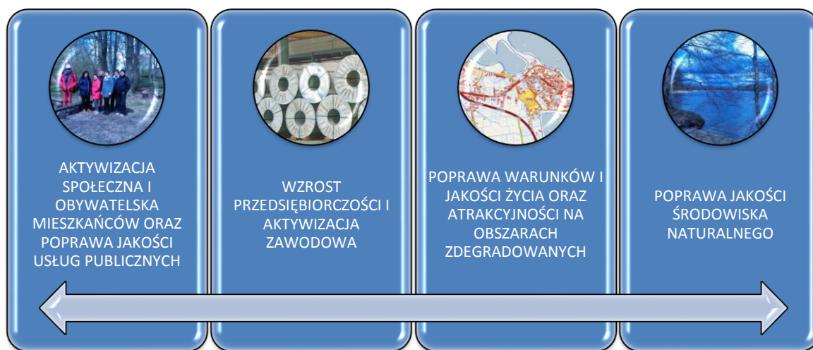
Rysunek 8. Cele szczegółowe LPR Gminy Lipiany na lata 2017 - 2022

Wobec sformułowanego celu głównego i celów szczegółowych przyjęto listę działań, które umożliwią realizację postawionych celów. W toku prac studyjnych i analitycznych założono, iż w każdej ze sfer działania te winny odnosić się do co najmniej trzech komponentów procesu rewitalizacji: 1) działań integracyjnych, polegających głównie na animacji społecznej ukierunkowanej na wspieranie uczestnictwa i partycypacji różnych kategorii mieszkańców, 2) działań adaptacyjnych, głównie o charakterze organizacyjno-technicznym oraz 3) działań inwestycyjnych – przywracających utracone wartości. Działania przyjmują postać projektów rewitalizacyjnych, które w kolejnej części LPR-u podzielono ze względu na powiązanie z obszarami rewitalizowanymi.