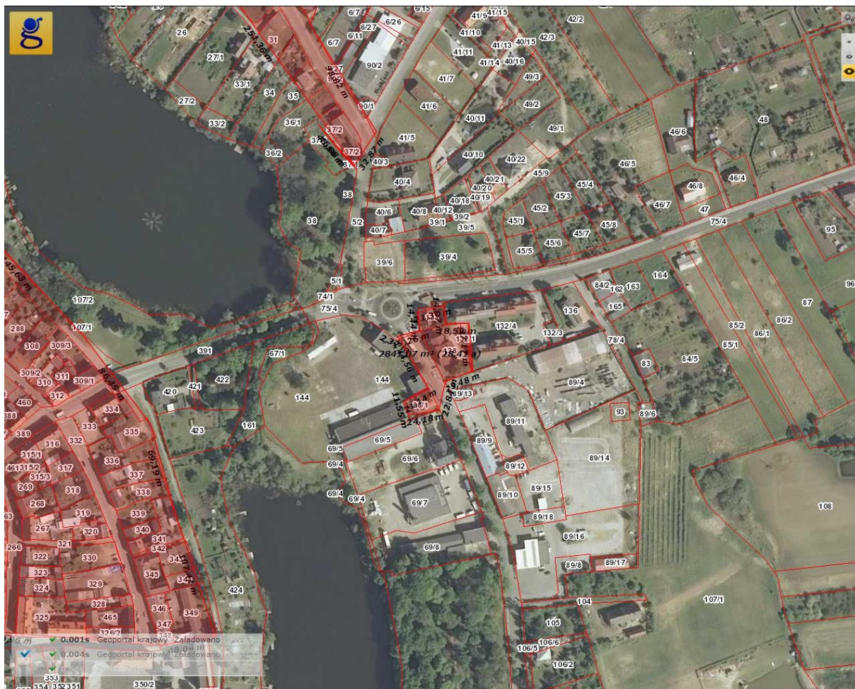
Rysunek 5. III obszar rewitalizacji - fragment ul. Myśliborskiej