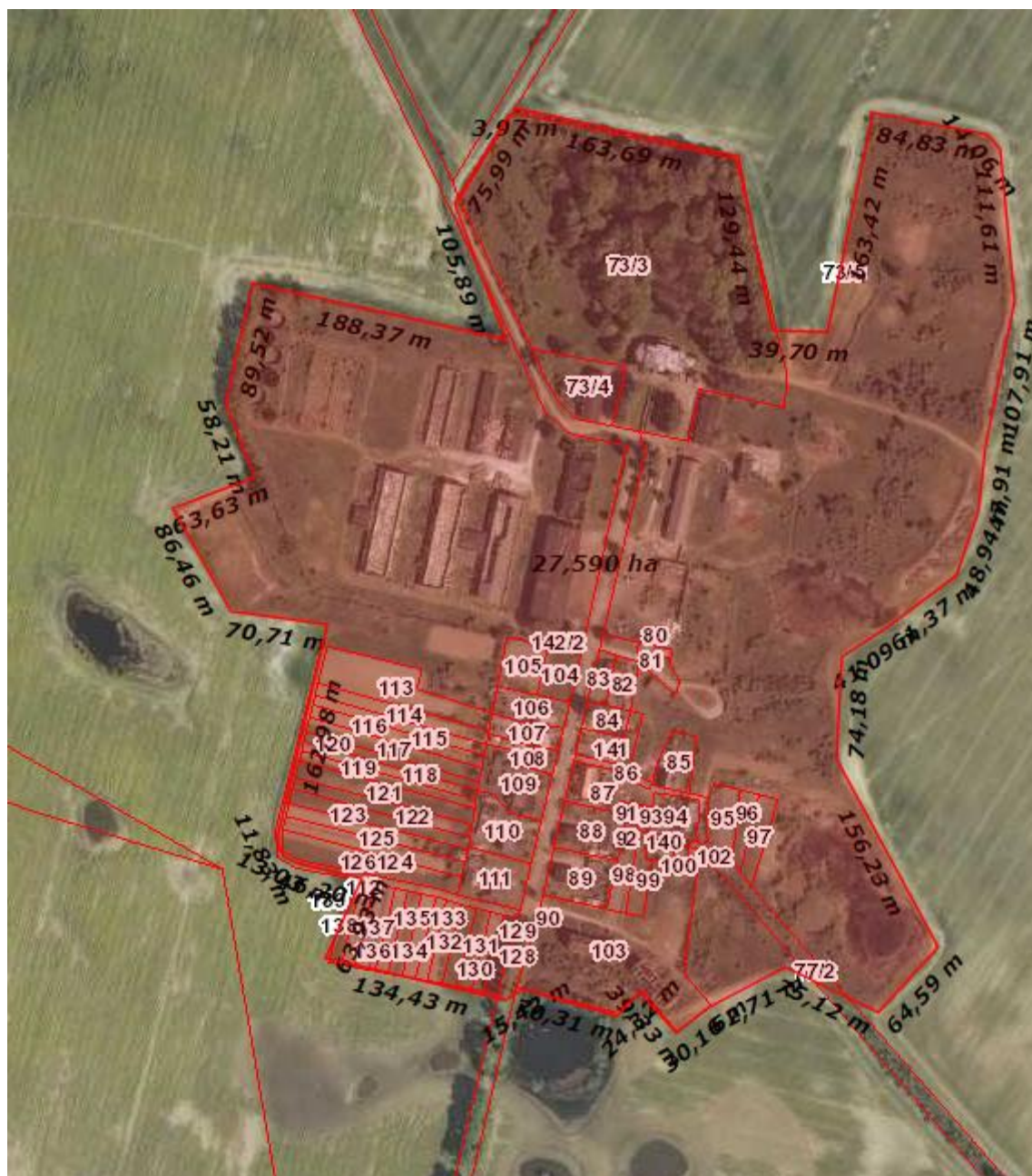
Rysunek 6. IV obszar rewitalizacji - Wieś Wołczyn