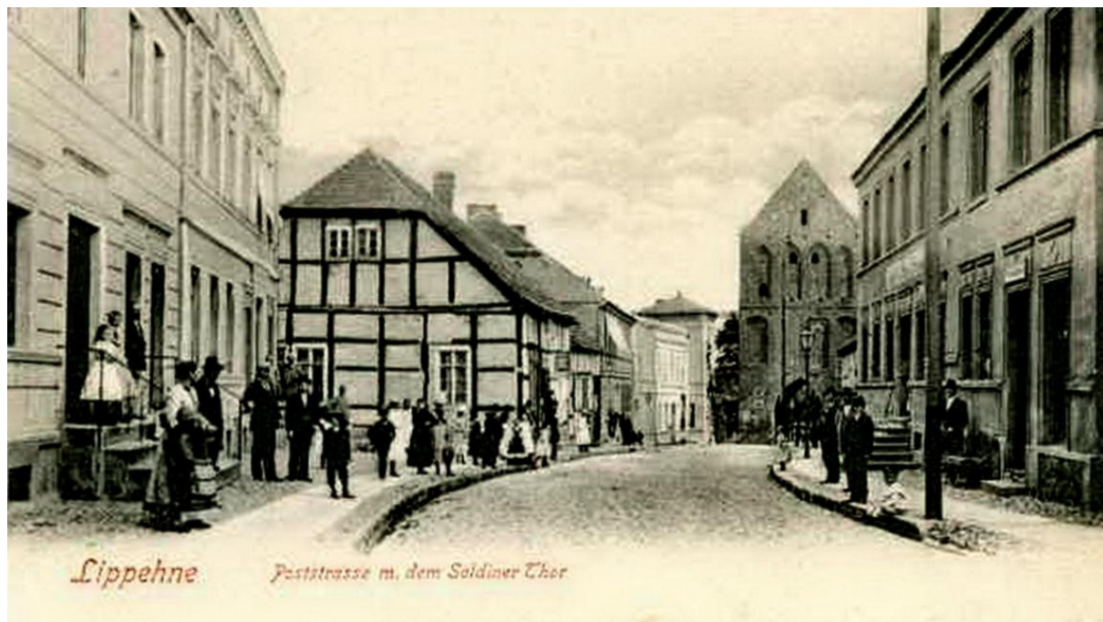
Rysunek 2. Brama Myśliborska w Lipianach, ok. 1903 r.